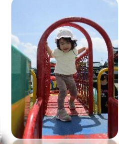
6.14 春の園庭であそぼう!